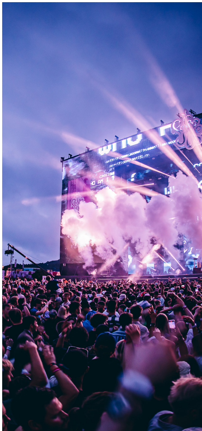
Palmesus på Bystranda

Kristiansand kommune forbeholder seg retten til å gripe inn i aktiviteter og arrangementer som det er gitt tillatelse til, dersom den etter en skjønnsmessig vurdering finner at det medfører urimelig støyplage. Hjemmelen finnes i folkehelseloven og forskrift om miljørettet helsevern. Kristiansand kommune påtar seg ikke ansvar for økonomiske konsekvenser av en slik inngripen.