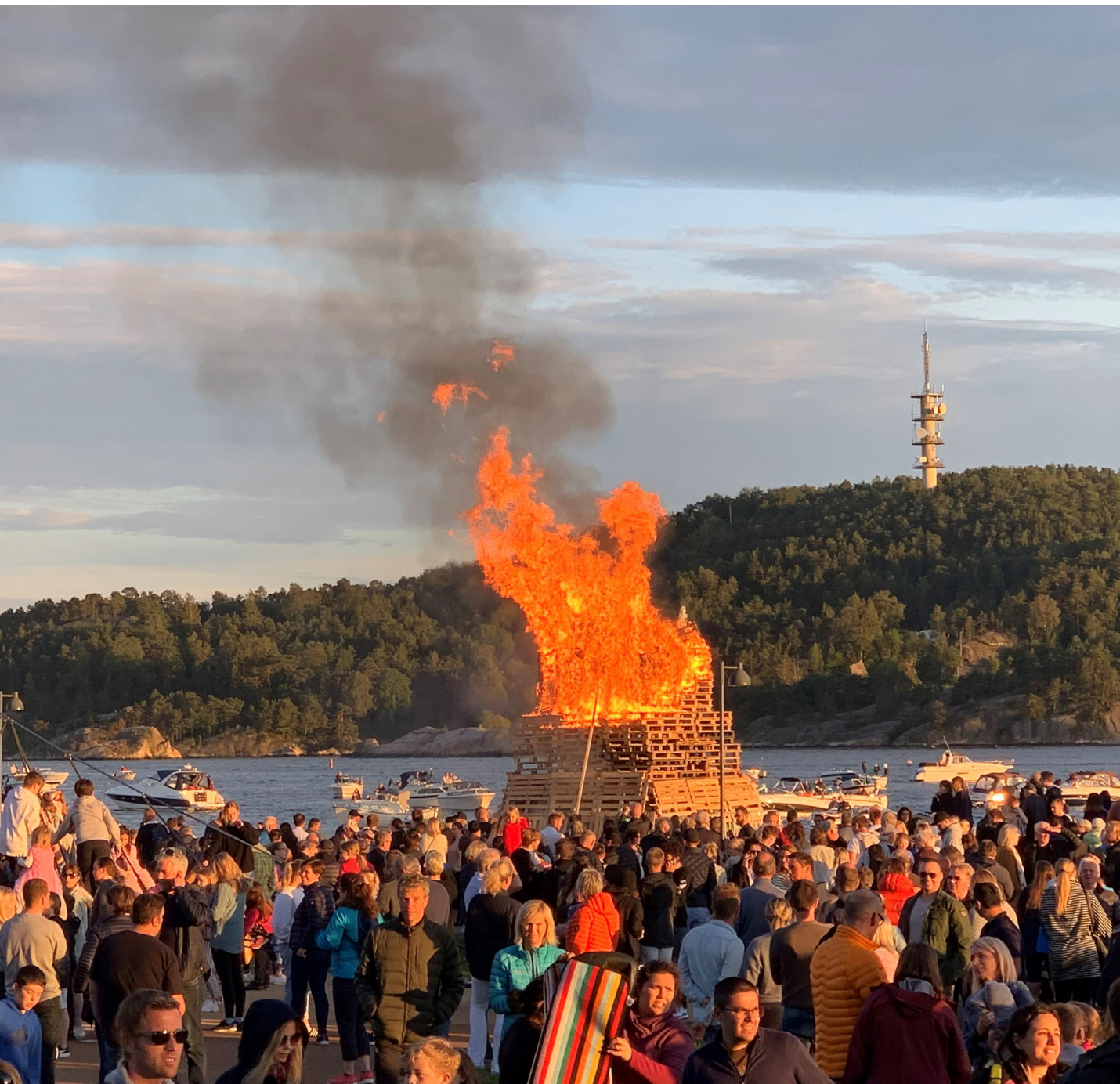
Sankthansfeiring på Tangen