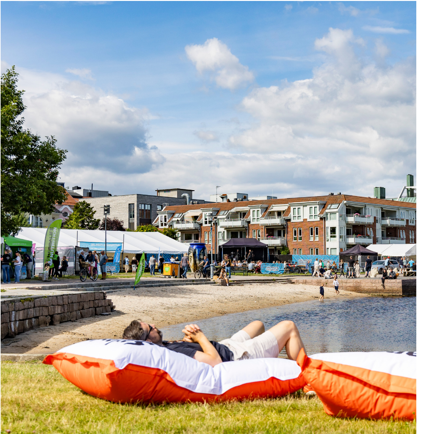
Matfestival på Gravane