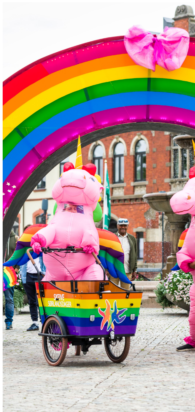
Skeive sørlandsdager på øvre torv

Kontaktinformasjon til skjenkebevilling ved Kristiansand kommune: E-post: postmottak@kristiansand.kommune.no Telefon: 38 07 50 00